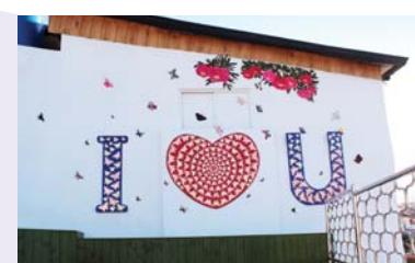
15/ 입체벽화 〈두석장- 나비의 꿈〉 장치길(팀장), 윤인자, 김진주

섬 많은 통영 동피랑에서 꿈의 월척 대형조각을 두고 내 삶의 꿈들도 이루어지는 상상의 날개를 펼쳐 보다