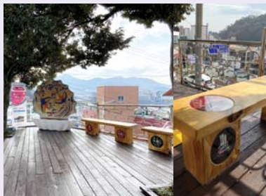
04/ 공간조성 〈까꾸막 나전센터〉 천기영(팀장) 박재성, 유정희, 정은정

아이들의 꿈처럼 추상적이지만 밝고 유쾌함으로 상상력을 되뇌이는 공간, 동피랑을 표현하다