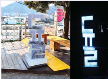
05/ 조형물 〈자음조명등〉 통영퍼블릭아트그룹

실내에 국한된 통영전통공예에 예술품 나전칠기의 작품감상을 실외로 확장하다