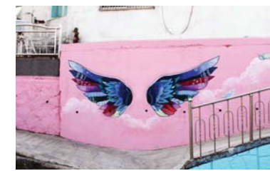
19/ 회화벽화 〈비몽-여왕의 꿈〉 통영퍼블릭아트그룹

공공미술프로젝트에 참여한 예술인의 주요 활동분야인 회화로 낡은 벽체에 화려한 예술의 혼을 입히다