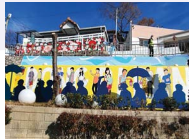
07/ 입체벽화 〈피어나라! 함께하는 동피랑〉 김경희(팀장), 서형일, 이인우, 임철수, 김혜진, 엄미란, 김민정, 임동열

나전칠기의 재료 조가비를 모티브 삼아 침공간으로, 포토존으로 쓰임을 확장하여 소소(笑少)한 재미, 소소(笑少)한 스토리텔링을 만들다