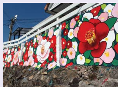
09/ 회화벽화 〈동백꽃〉 통영퍼블릭아트그룹

통영 앞바다에서 잡은 생선과 연탄을 리어카에 싣고 행복한 발걸음으로 집으로 향하는 그 옛날 정겨운 우리들의 삶과 생활을 동피랑 골자락에 그려 보다