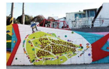
20/ 주민참여형 입체벽화 〈주민의 얼굴〉 박동주(팀장) 김태영, 김미옥, 이선정

공공미술프로젝트에 참여한 예술인의 주요 활동분야인 회화로 낡은 벽체에 화려한 예술의 혼을 입히다