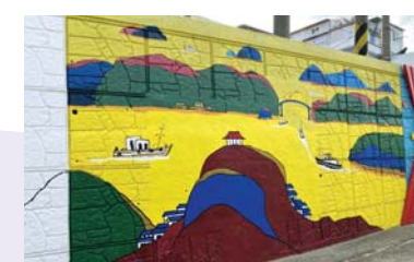
21/ 회화벽화 〈노을진 통영항〉 통영퍼블릭아트그룹

비다와 어우러진 삶 속의 통영사람들, 그들의 어제와 오늘, 미래를 꿈꾸는 얼굴표정을 주민과 함께 그릇 속에 담다