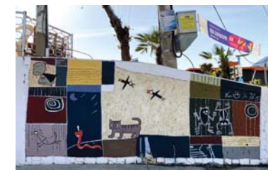
18/ 회화벽화 〈회상〉 통영퍼블릭아트그룹

늘 마주치는 동피랑아줌마 그늘에 머물고있는 반려 동물들의 모습을 기억에 오래 남길수 있게 작은 십터에 담다