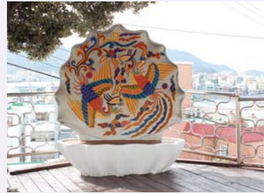
06/ 조형물 〈조개아트벤치〉 통영퍼블릭아트그룹

나전칠기의 재료 조가비를 모티브 삼아 침공간으로, 포토존으로 쓰임을 확장하여 소소(笑少)한 재미, 소소(笑少)한 스토리텔링을 만들다