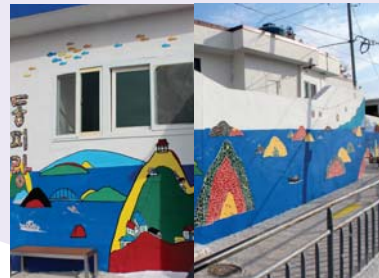
10/ 입체벽화 〈동피랑과 통영팔경〉 김영숙(팀장), 박동열, 진영욱, 권혜숙, 이임숙, 김정좌, 김옥순, 최규태, 김미옥, 김태영, 정지은

공공미술프로젝트에 참여한 예술인의 주요 활동분야인 회화로 낡은 벽체에 화려한 예술의 혼을 입히다