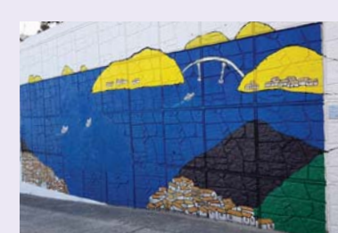
22/ 회화벽화 벽화 [리뉴얼] 통영퍼블릭아트그룹

공공미술프로젝트에 참여한 예술인의 주요 활동분야인 회화로 낡은 벽체에 화려한 예술의 혼을 입히다