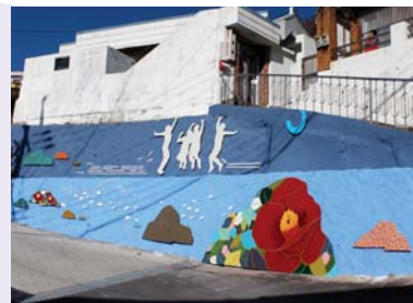
03/ 입체벽화 〈꿈피랑〉 최봉근(팀장), 이구호, 설희숙

공공미술프로젝트에 참여한 예술인의 주요 활동분야인 회화로 낡은 벽체에 화려한 예술의 혼을 입히다