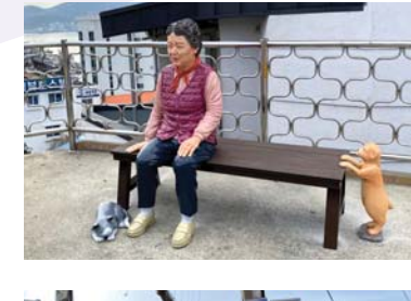
17/ 조형물 〈아줌마와 반려동물〉 통영퍼블릭아트그룹

늘 마주치는 동피랑아줌마 그늘에 머물고있는 반려 동물들의 모습을 기억에 오래 남길수 있게 작은 십터에 담다