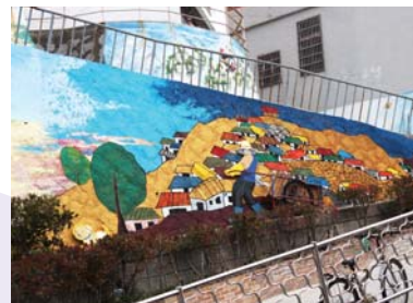
08/ 입체벽화 〈그 옛날 동피랑〉 통영퍼블릭아트그룹

동피랑 옆 신선한 해산물로 활기찬 중앙시장과 왕래하는 사람들, 동백꽃으로 새롭게 피어나는 동피랑에 함께 담아내다