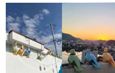
13/ 조형물 〈소풍나온 갈매기〉 통영퍼블릭아트그룹

통영 강구안과 시내 풍경이 발아래 펼쳐지면 잠시나마 자전거로 배로 하늘을 날며 자유를 즐기는 상상을 하다.