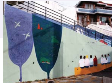
02/ 회화벽화 〈꿈〉 통영퍼블릭아트그룹

통영의 중심부에 위치한 동피랑, 그 속에서 생활하는 주민의 희노애락을 조형적 입체얼굴에 담다